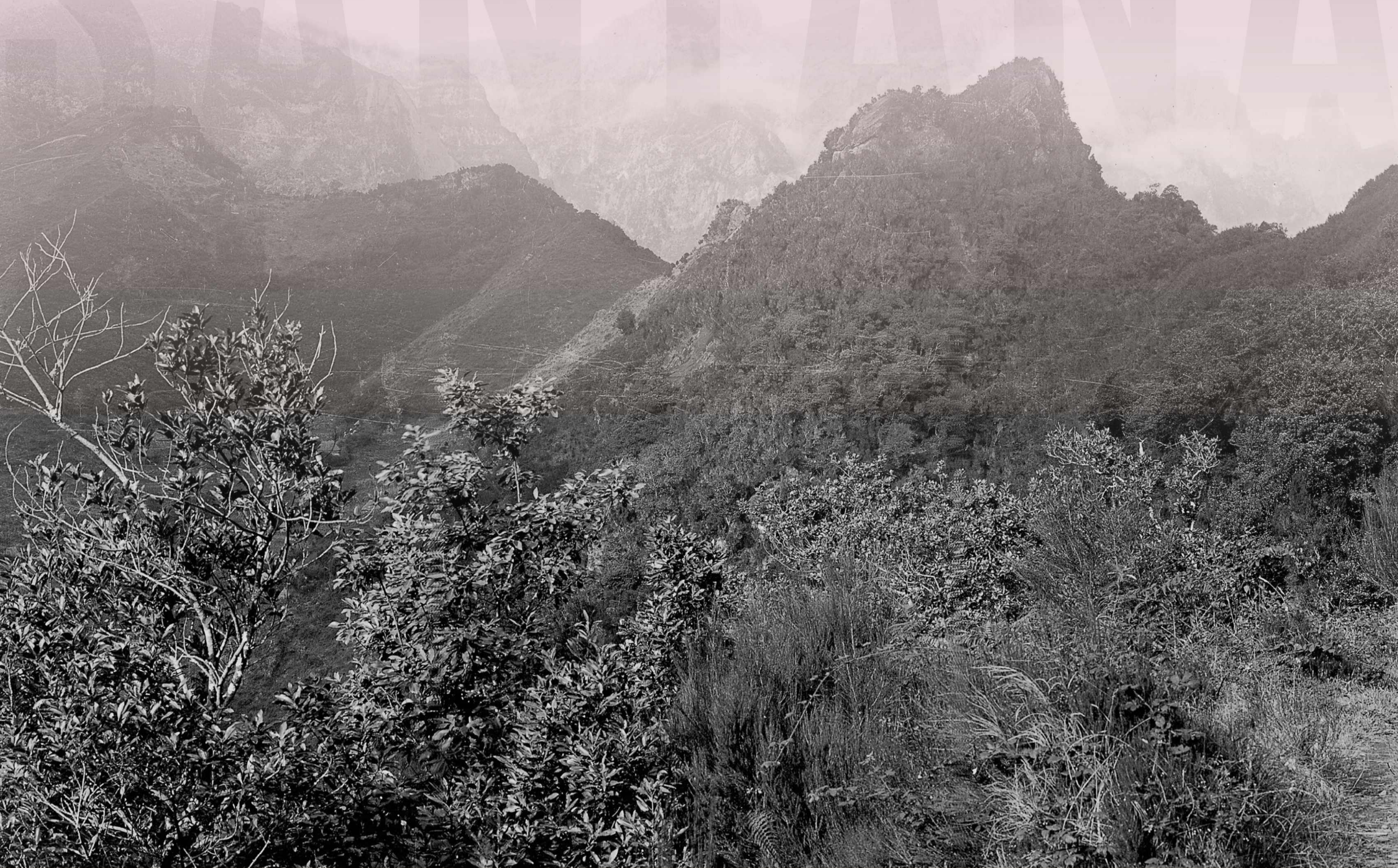
Panorâmica das montanhas do Juncal e do Arieiro e da parte alta da Fajã da Nogueira; observa-se, à direita, o Pico do Gato. Foto Perestrellos, data não identificada, negativo em vidro, MFM-AV, em depósito no ABM, PER/20.