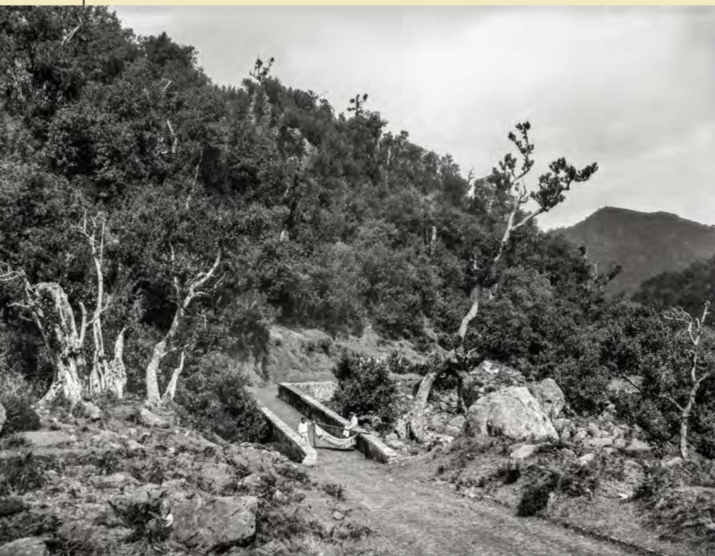
Hammock and its drivers, dressed in white, on a bridge on the Royal Road 24, in Ribeiro Frio; one can see: the ends of the hammock resting on the wall of the bridge and on the forks of staffs; in the background, another hammock in a resting position and some people on the path, behind the vegetation. Photo by Joaquim Augusto de Sousa, before 1905, glass plate negative, MFM-AV, in deposit at ABM, JAS/905.