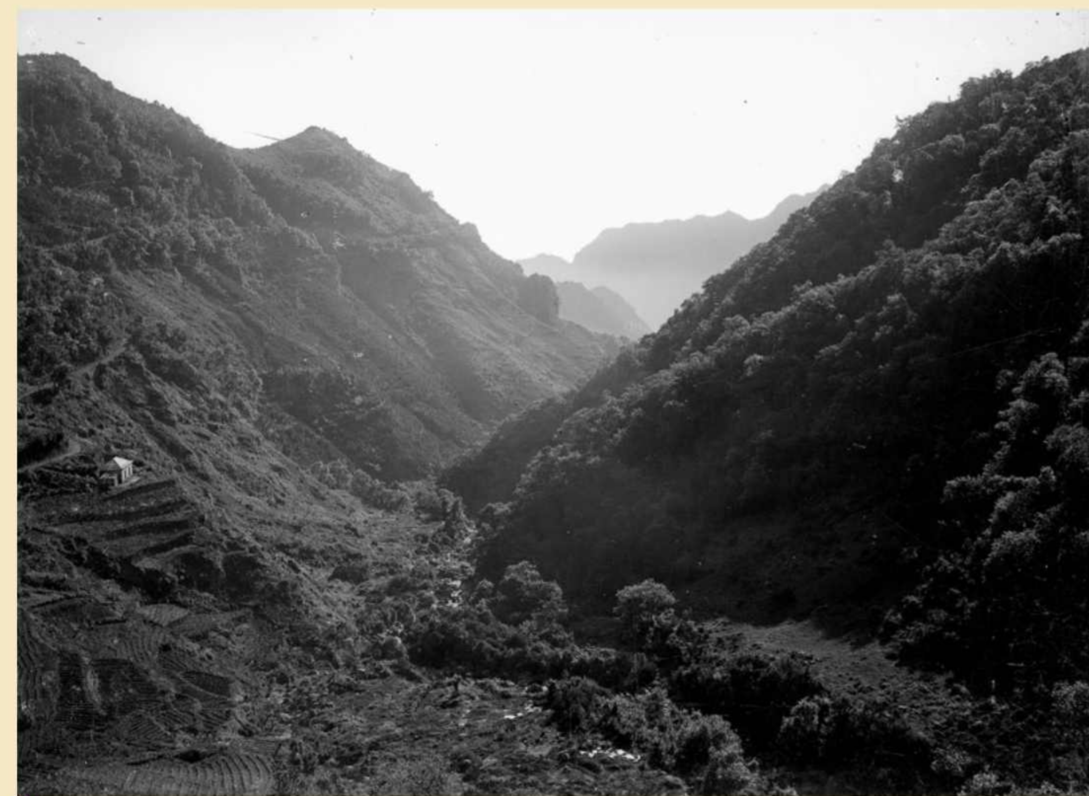
Panorâmica do vale do Ribeiro Frio; observam-se: em primeiro plano, roupa a corar nas margens do ribeiro; à esquerda, polos e uma casa com cobertura de telha abaixo do serpenteir da Estrada Nacional 3 (atual Estrada Regional 103). Foto Perestrellos, post. 1930, negativo em vidro, MFM-AV, em depósito no ABM, PER/28.