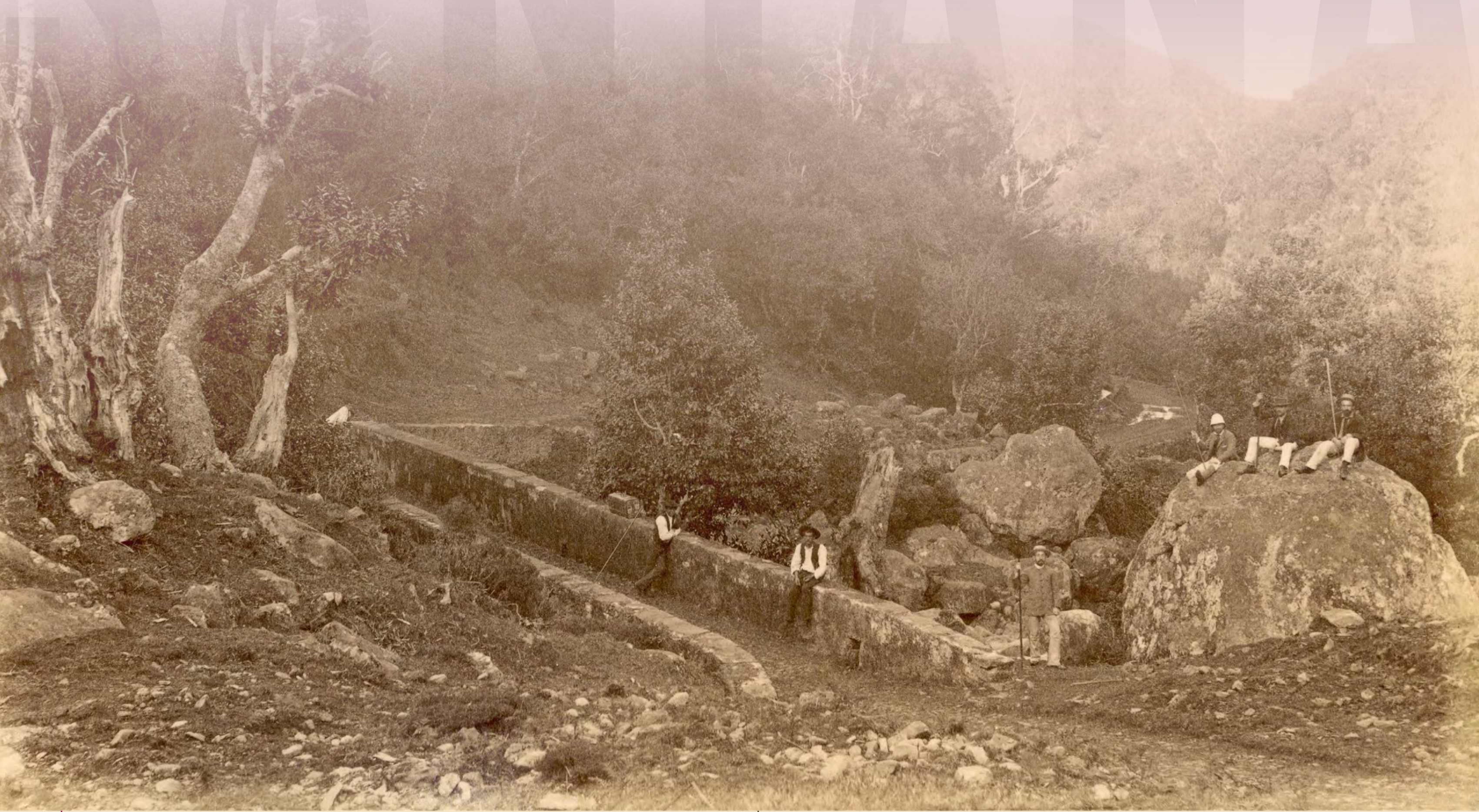
Ponte da Estrada Real 24, no Ribeiro Frio; observam-se: da esquerda para a direita, três homens em cima da ponte, outro apoiado num bordão e três em cima de uma rocha. Foto René Masset, entre 1885 e 1895, prova fotográfica, MFM-AV, em depósito no ABM, RMA/1.77.