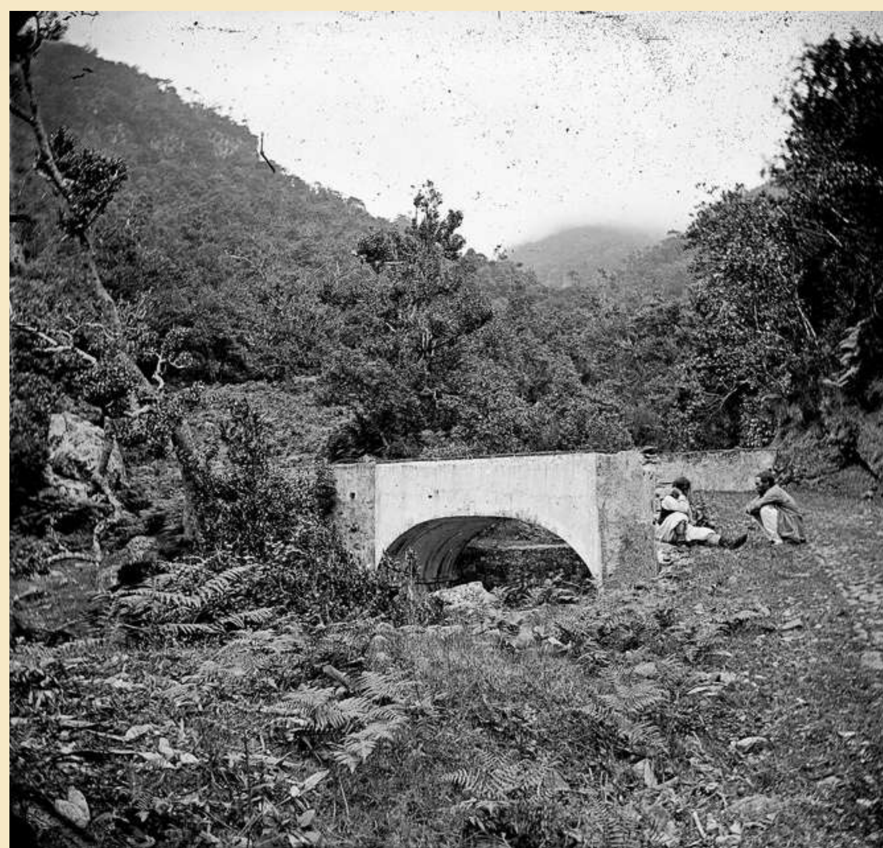
Ponte do Ribeiro Frio; observam-se: ao centro, o arco da ponte de alvenaria e reboco; à direita, um homem sentado no muro, vestido com o traje regional, e outro sentado no orla da Estrada Real 24. Foto Vicente, segunda metade do século XIX, negativo em vidro, MFM-AV, em depósito no ABM, VIC/243.