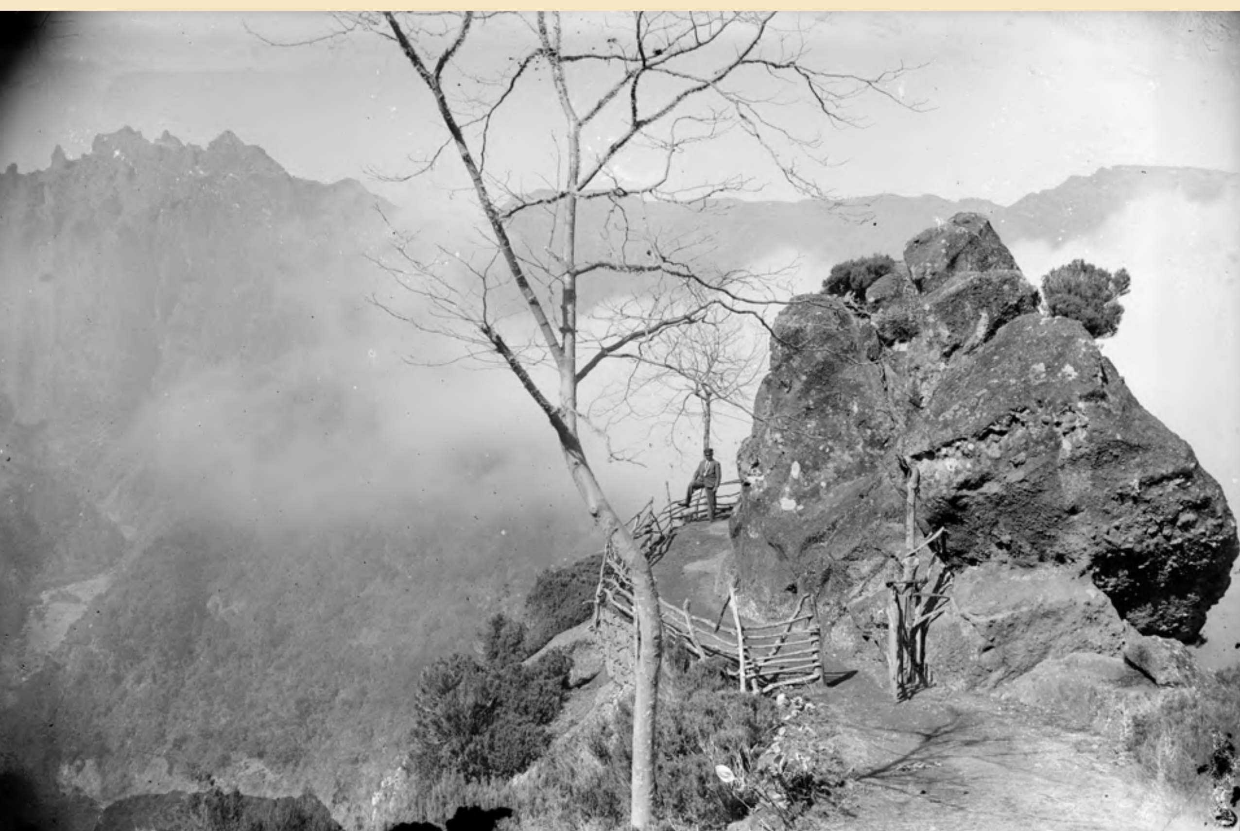
Miradouro das Balcões, no Ribeiro Frio; observam-se: um homem a posar com um pé apoiado na cerca; um portão de madeira; ao fundo, o Pico das Torres, o Pico Ruivo e o sítio da Achada do Teixeira. post. 1930, negativo em vidro, PHF/2177.