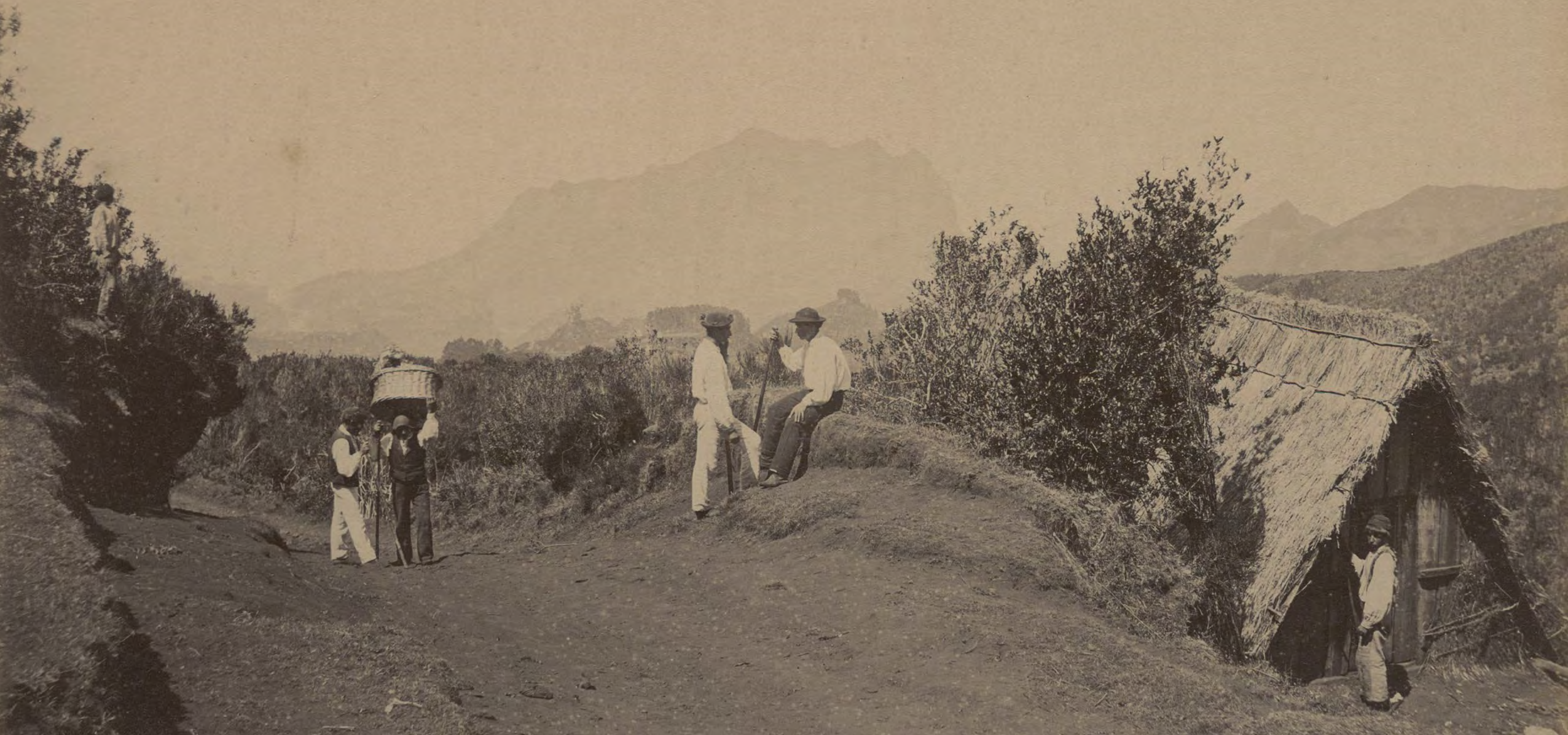
Estrada Real 24, no sítio da Achada do Cedro Gordo; observam-se: à esquerda, um homem sobre uma elevação; na estrada, um homem com molheira, bordão e cesta de vimes sobre os ombros e outro homem apoiado num bordão; um homem de pé e outro sentado na bermagem do caminho, ambos apoiados em bordões; à direita, um homem em frente de uma casa com cobertura de colmo; ao fundo, a foz da ribeira do Faial e a Penha d'Águia. Foto João Francisco Camacho, entre 1863 e 1876, prova fotográfica, MFM-AV, em depósito no ABM, SFB/1.11.