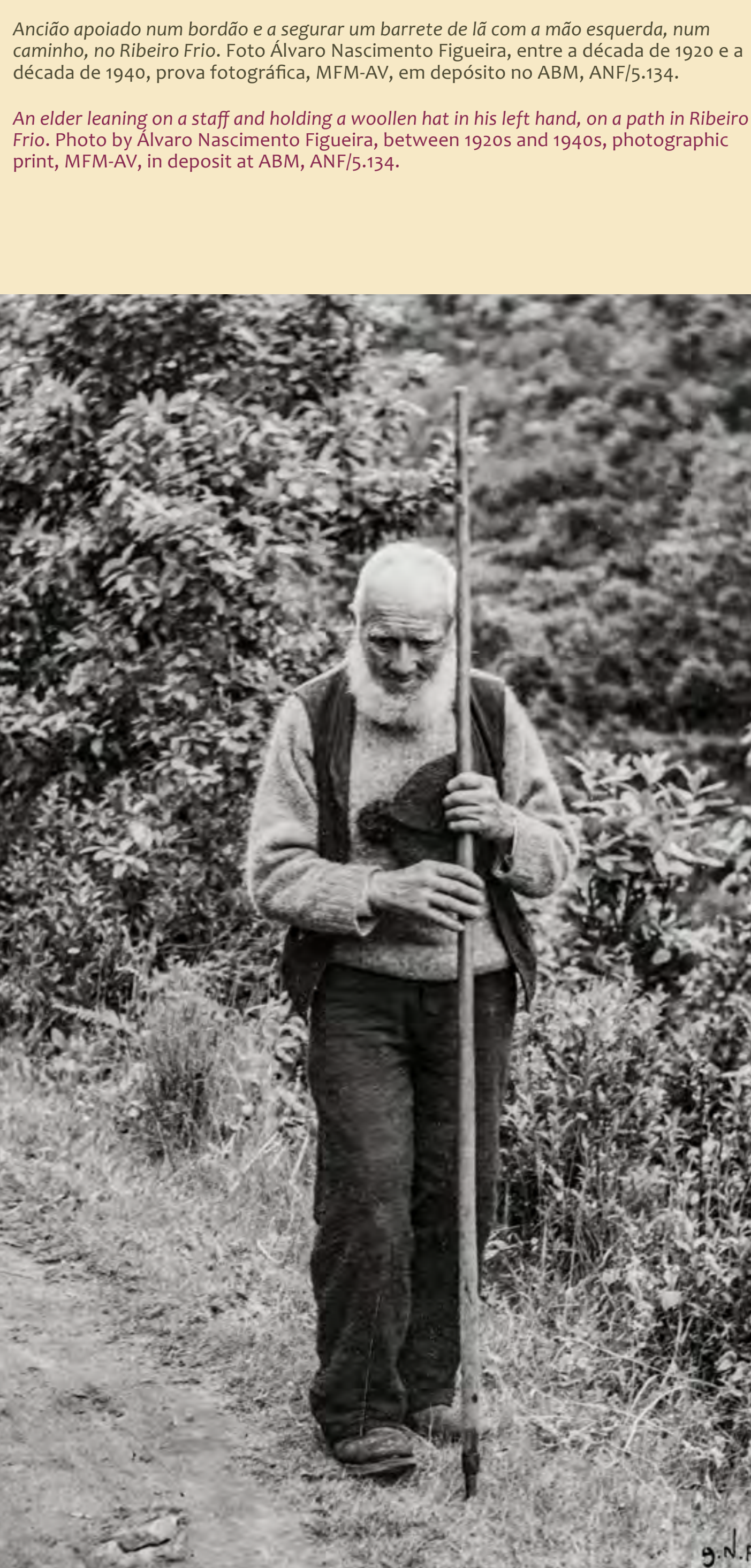
Avô apoiado num bordão e a segurar um barrete de lã com a mão esquerda, num caminho, no Ribeiro Frio. entre a década de 1920 e a década de 1940, prova fotográfica, ANF/5-134.