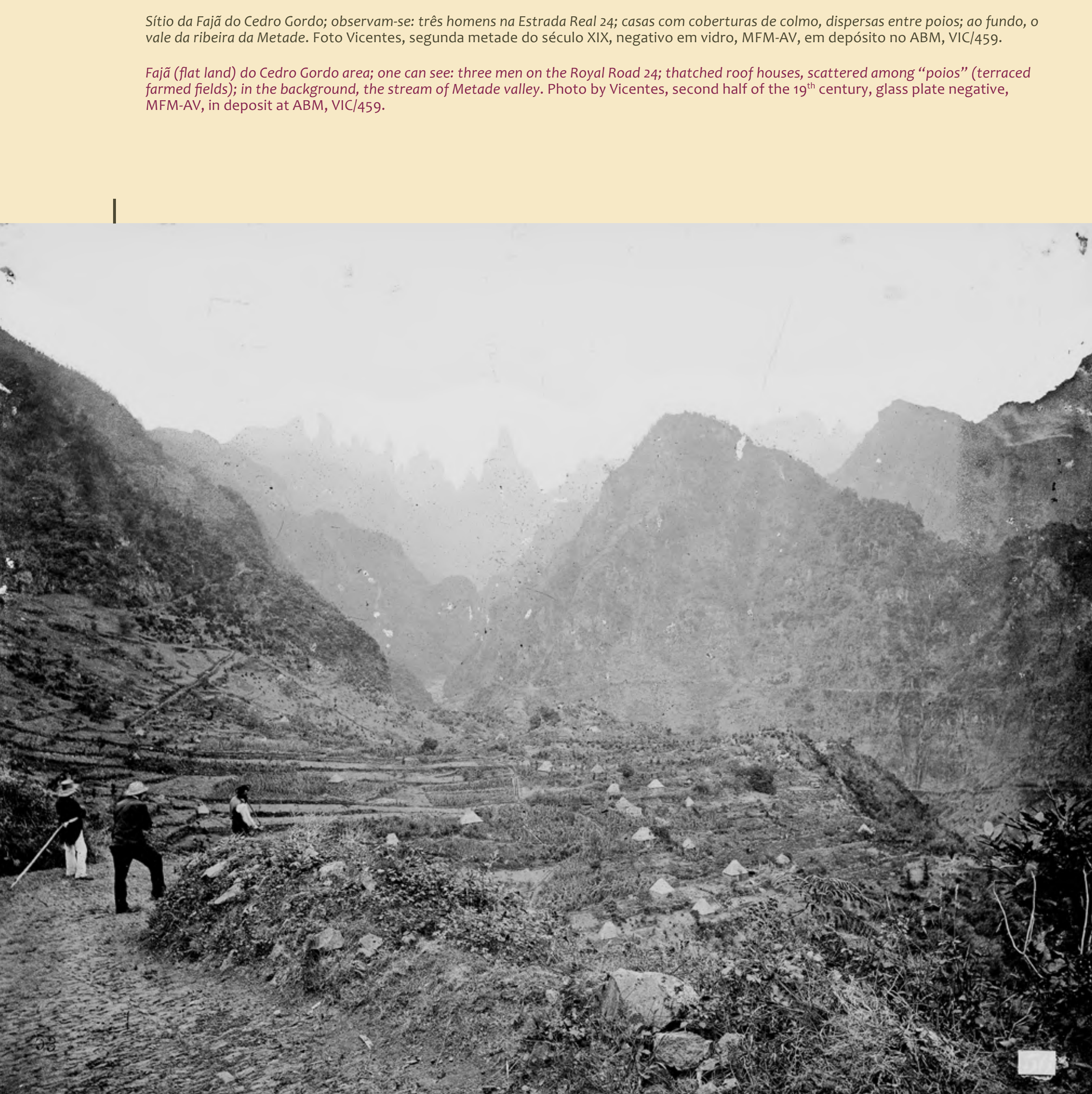
Sítio da Fajã do Cedro Gordo; observam-se: três homens na Estrada Real 24; casas com coberturas de colmo, dispersas entre poios; ao fundo, o vale da ribeira da Metade. Foto Vicente, segunda metade do século XIX, negativo em vidro, MFM-AV, em depósito no ABM, VIC/459.