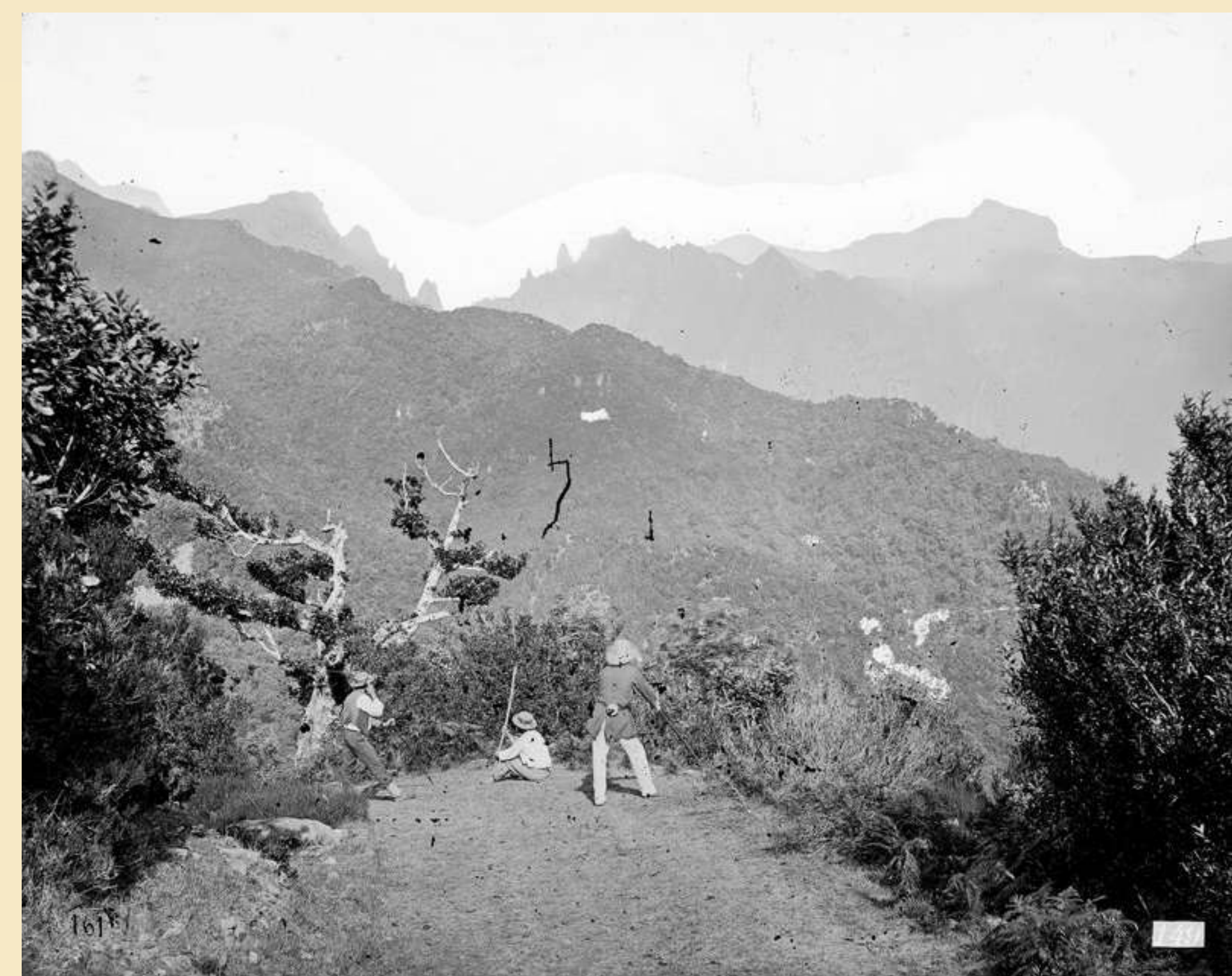
Estrada Real 24, no acesso ao Ribeiro Frio; observam-se: dois homens de pé, apoiados em bordões, e outro homem sentado no pavimento; ao fundo, o Pico do Areeiro, o Pico do Gato, o Pico das Torres e o Pico Ruivo. Foto Vicente, 1899, negativo em vidro, MFM-AV, em depósito no ABM, VIC/448.