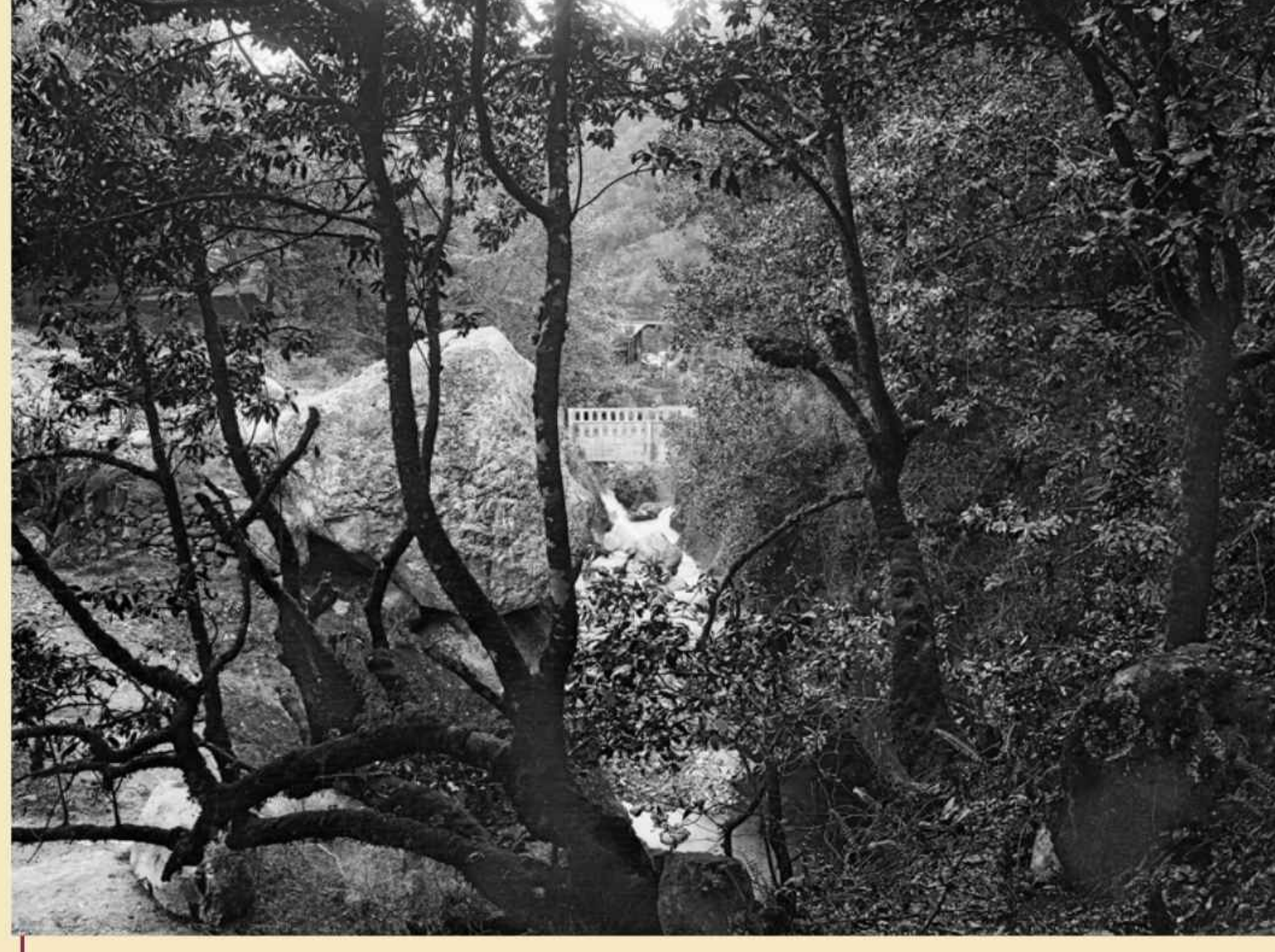
Vista do Ribeiro Frio; por entre a vegetação, observam-se, ao centro, o leito do ribeiro e a balaustrada de uma ponte. Foto Perestrellos, post. 1932, negativo em vidro, MFM-AV, em depósito no ABM, PER/362.