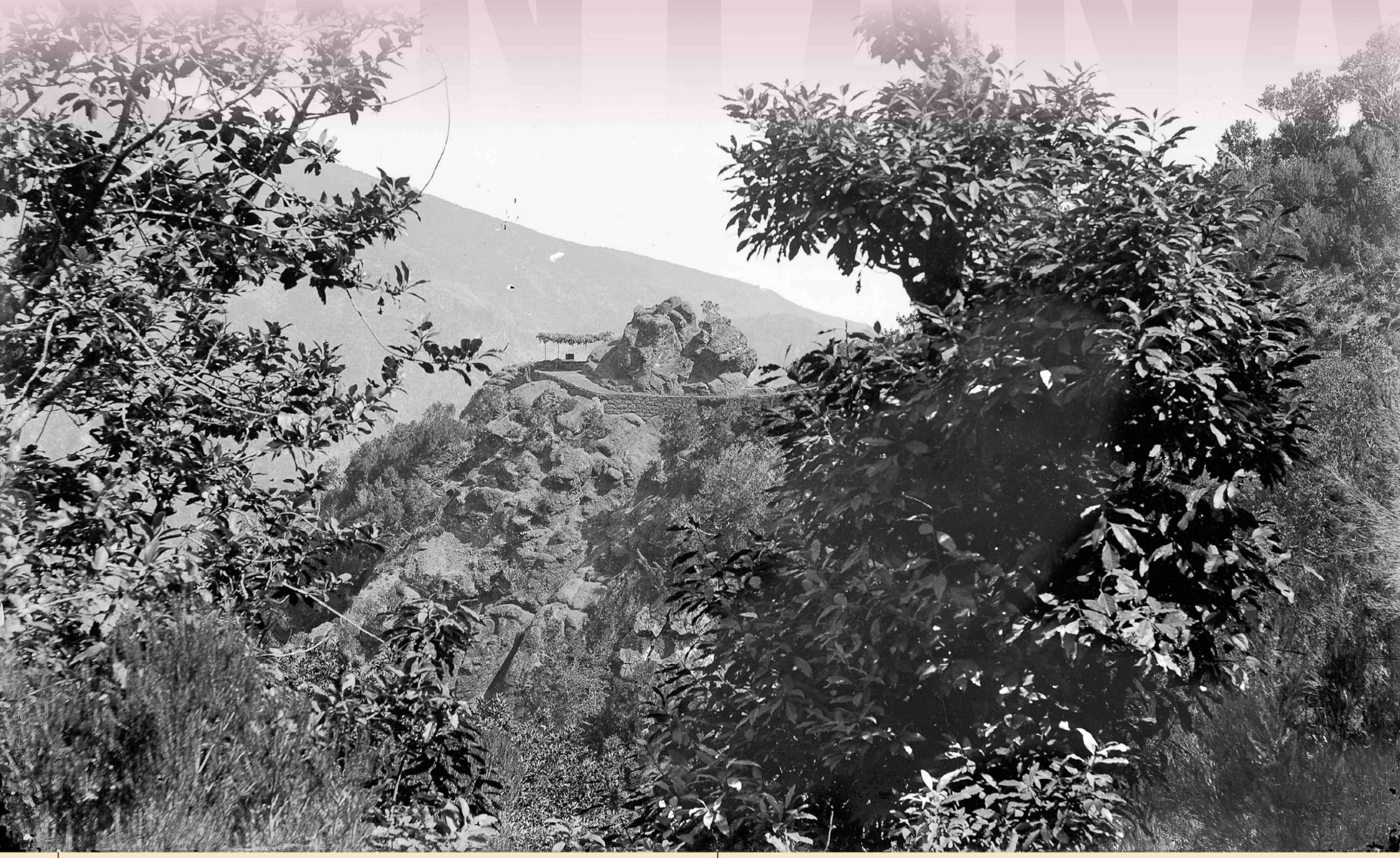
Vista do miradouro dos Balcões, a partir da vereda dos Balcões; observa-se, por entre a vegetação, o acesso ao miradouro. Foto Perestrellos, data não identificada, negativo em vidro, MFM-AV, em depósito no ABM, PER/48.