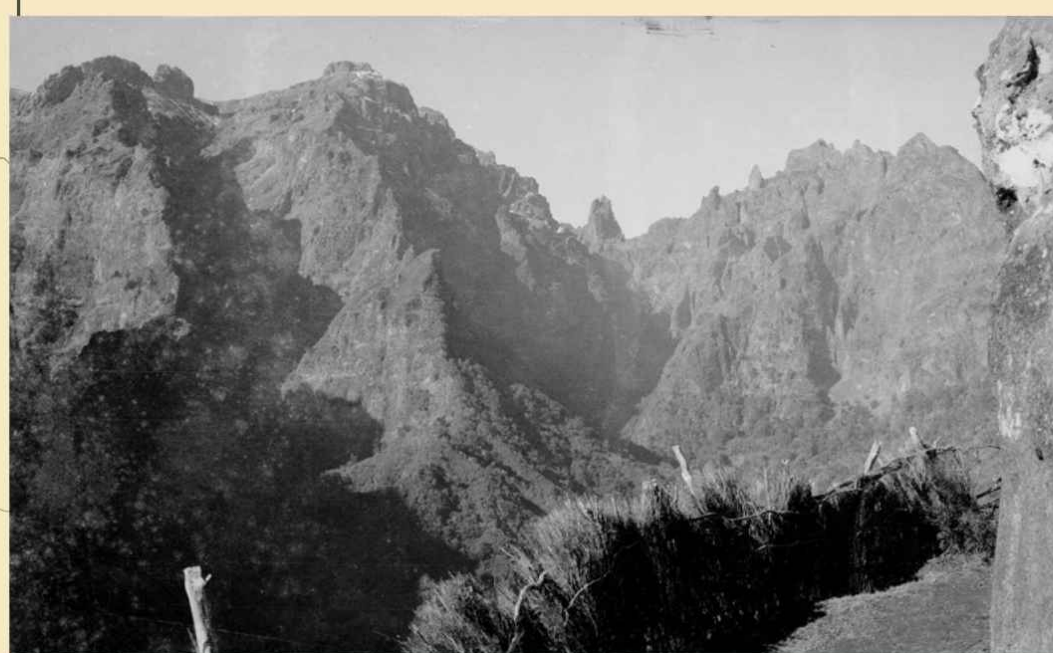
Panoramic view of Madeira's central mountain range, from Balcões viewpoint, in Ribeiro Frio; one can see: a hedge bordering the circulation area; in the background, Pico (peak) do Areeiro, with snow-covered areas, Pico do Gato and Pico das Torres. Photo by Perestrellos, unknown date, film negative, MFM-AV, in deposit at ABM, PER/750.